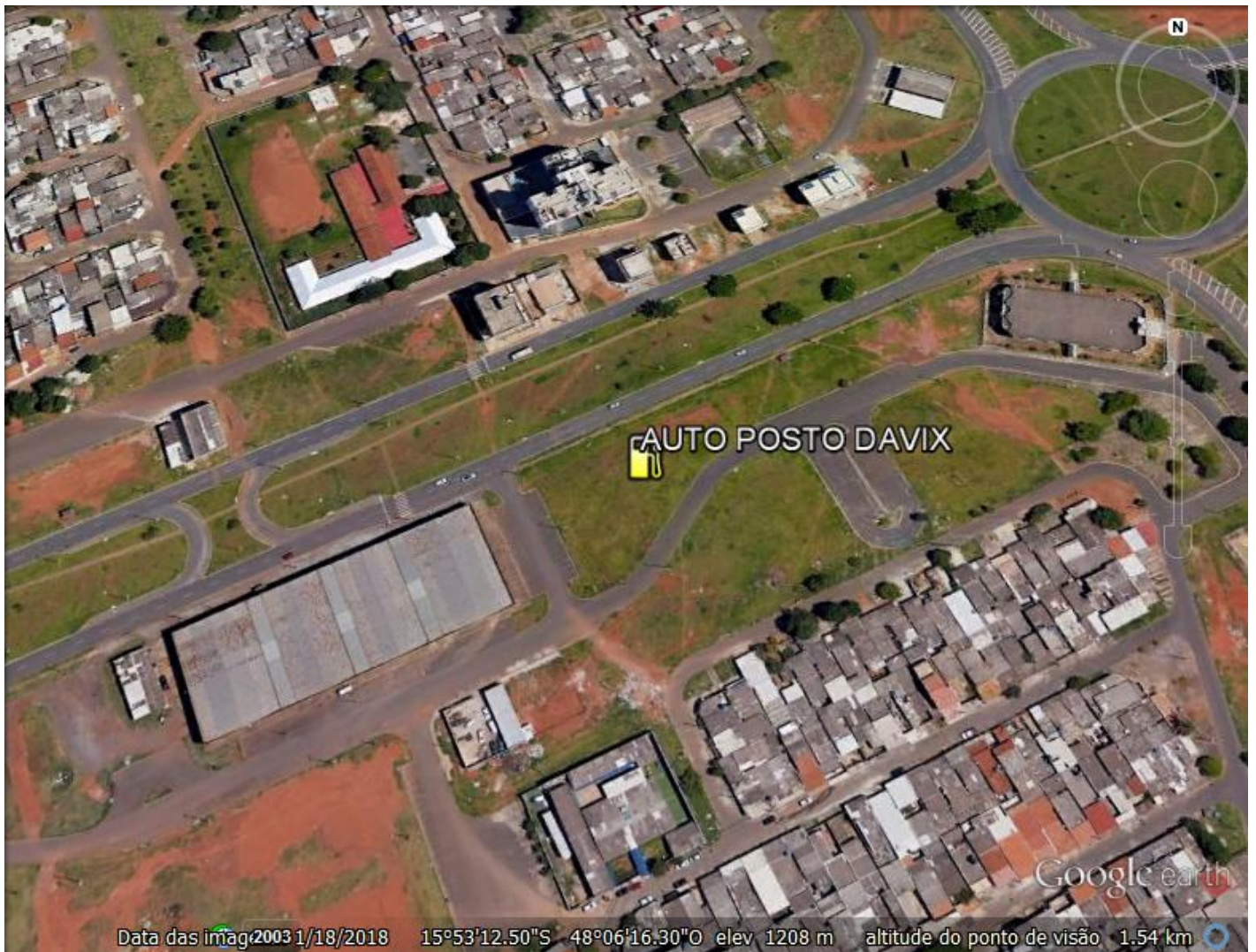
Figura 1: Localização do empreendimento. Fonte da Imagem: Software Google Pro , data da imagem: 18/01/2019