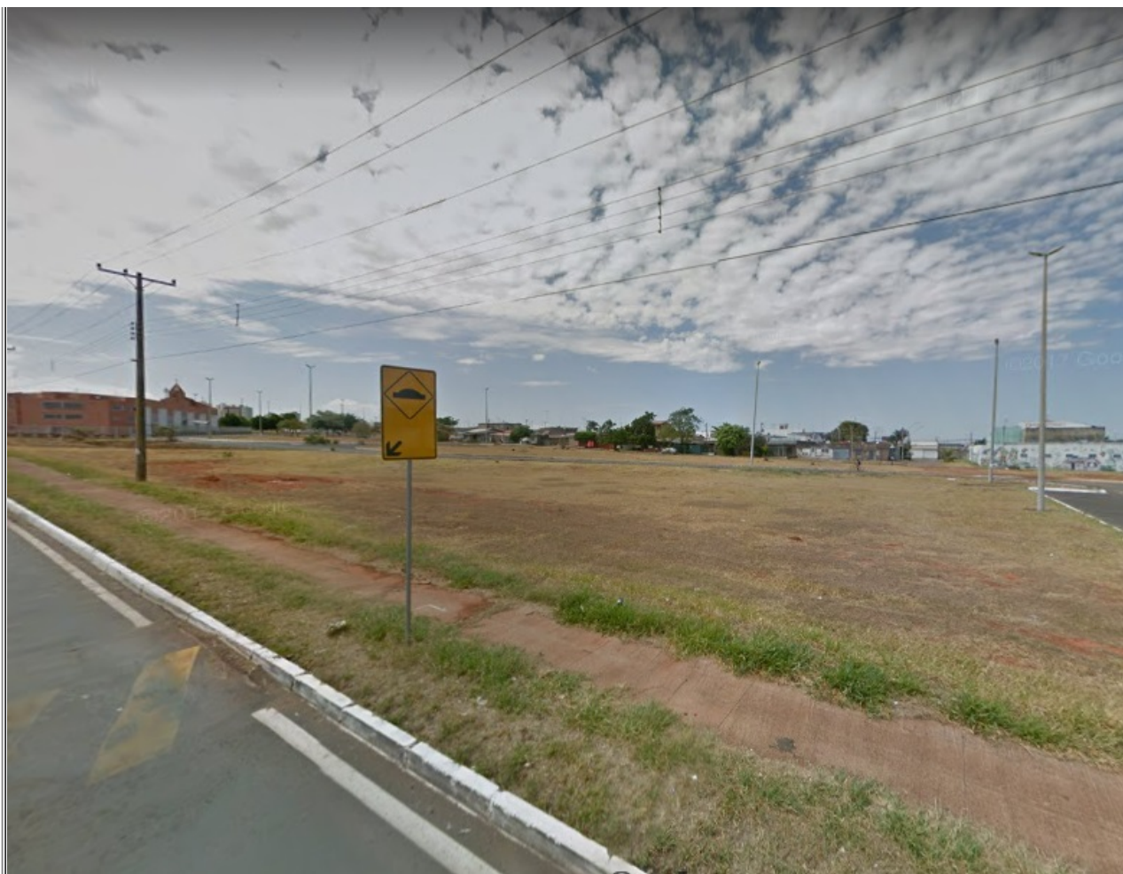
Figura 2: Vista frontal do terreno a ser implantado o empreendimento - Lote 2.